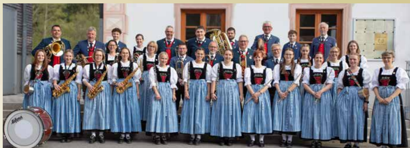
175 - Jahr - Jubiläum der Musikkapelle Bach

Die Musikkapelle Bach wurde 1894 gegründet und feiert dieses Jahr ihr 175-Jahr-Jubiläum. Dazu gibt es im Sommer neben den üblichen Platzkonzerten gemeinsam mit der Musikkapelle Stockach zwei Jubiläums-Platzkonzerte.