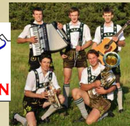
Instrumente-Vorstellung bei der „Musikschnitzeljagd“ gemeinsam mit der MK Stockach

Gemeinsam mit der Musikkapelle Stockach fand am Sonntag, den 5. Mai 2024, die Musikschnitzeljagd statt. Bei dieser Schnitzeljagd durch die „Au“ hatten die Kinder die Möglichkeit, jedes Instrument kennenzulernen und auszuprobieren. Es waren sehr viele begeisterte Kinder dabei. Gemeinsam hatten wir einen schönen Nachmittag.